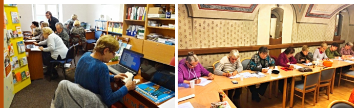
Ilustrační foto z českokrumlovského centra pro seniory